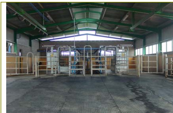
Entrada de les vaques a la sala