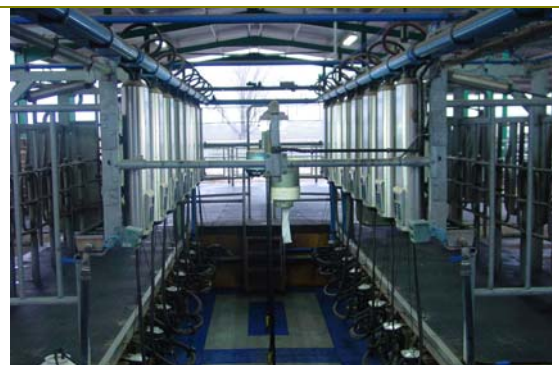
Sala de munyir