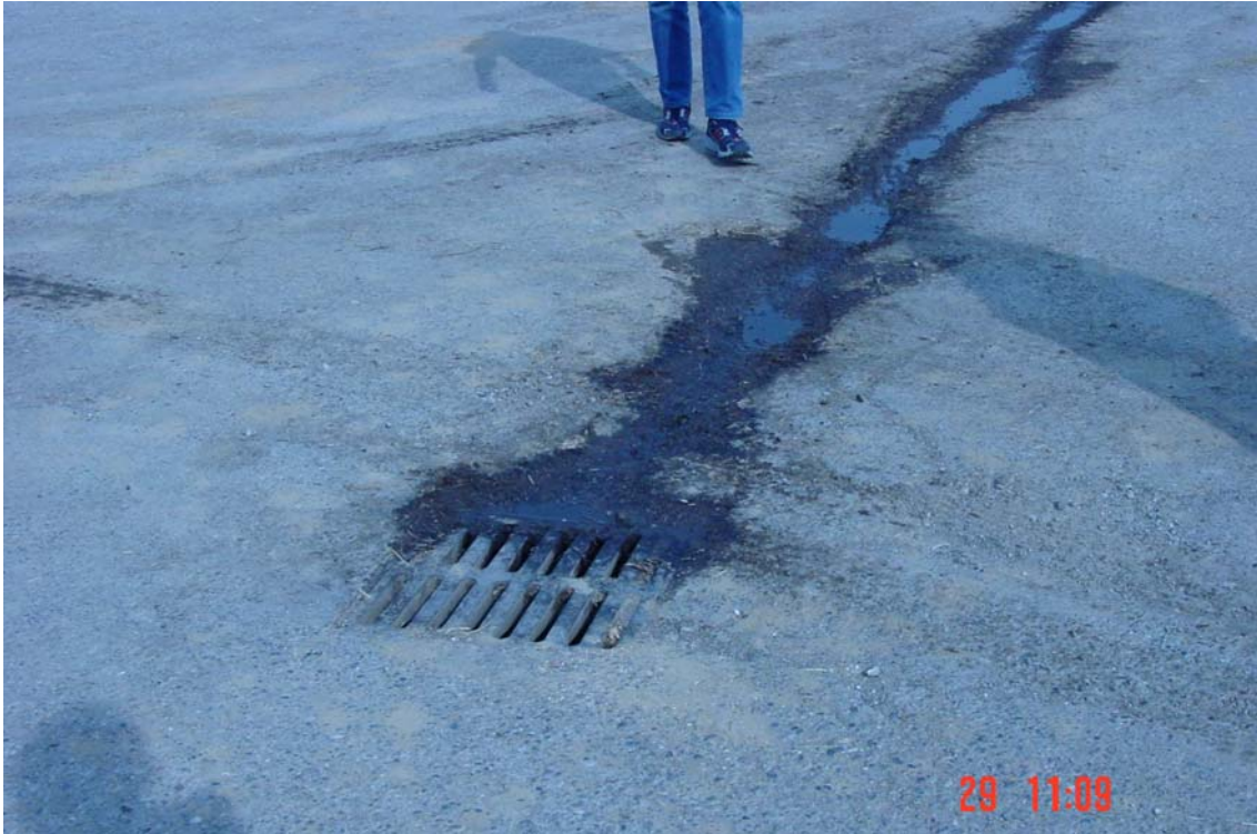
Recollida sucres ensitjats