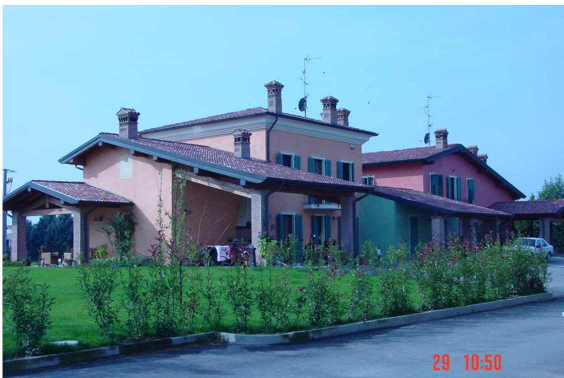
Cases dels dos germans Gavezoli