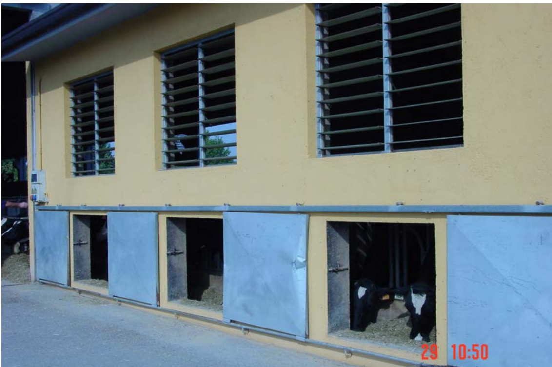
Ampliació menjadora dins de l'edifici sala de munyir