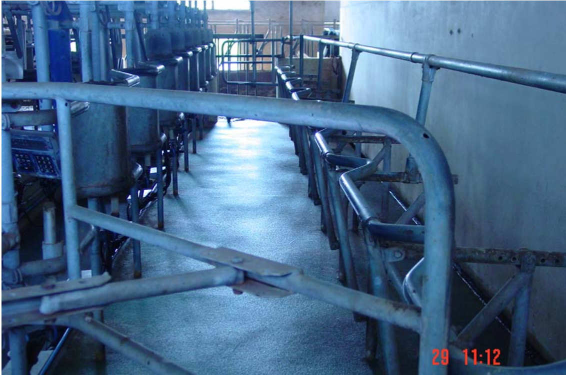
Passadis sortida sala munyir