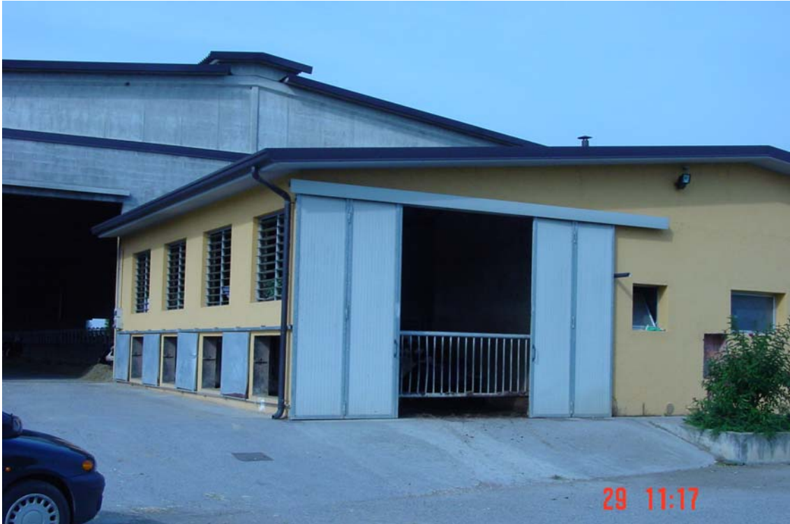
Edifici sala munyir i ampliació menjadora