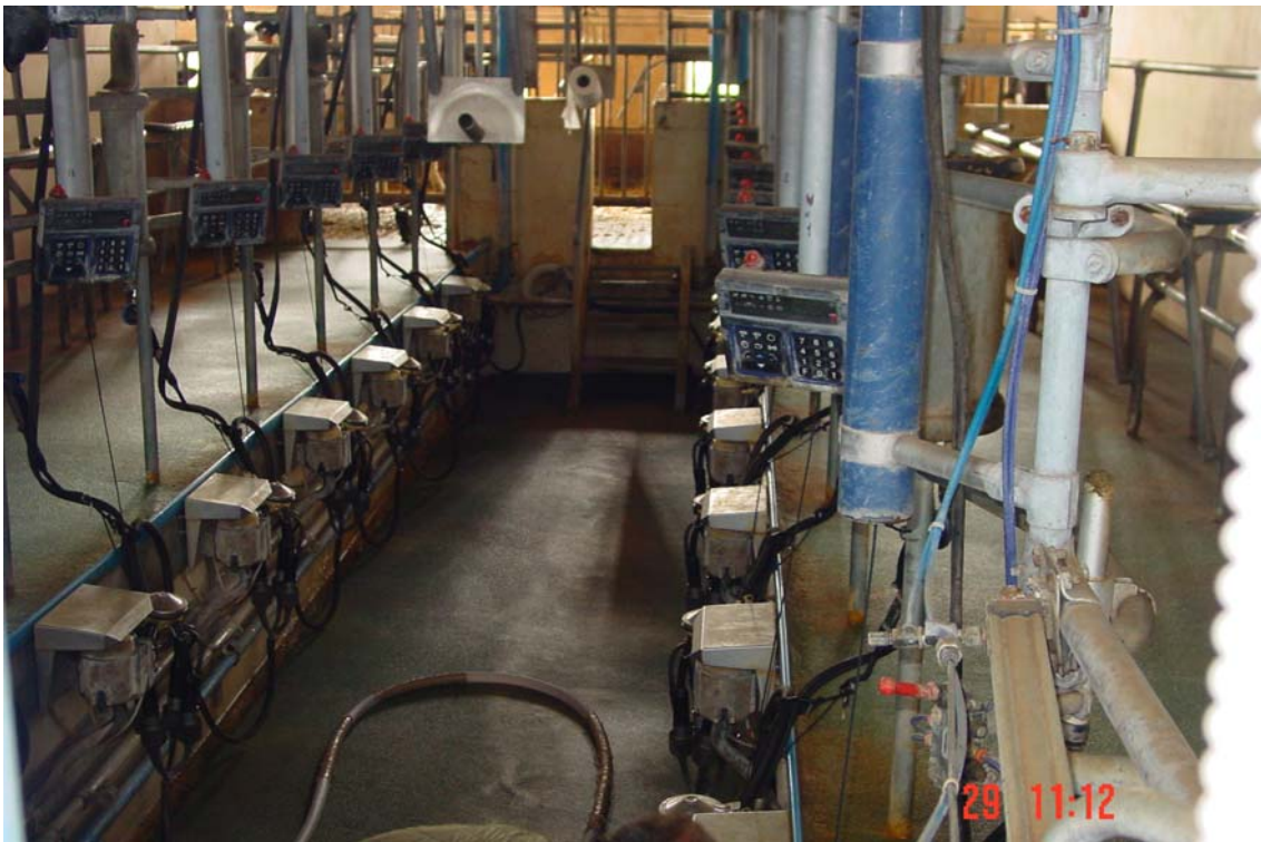
Sala de muntir